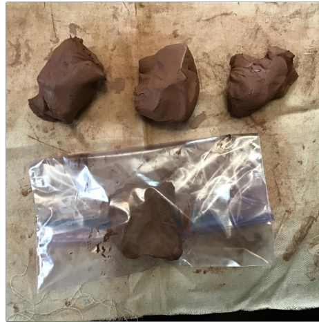
2. Divide your clay into four pieces: one for a base , two for coils , and one for everything else and for emergencies. 점토를 4 개의 조각으로 나눕니다 : 하나는베이스, 코일은 2 개, 다른 모든 것과 비상 사태에 대해 나눕니다.